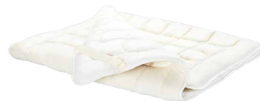
Auflage Schafschurwolle Solo oder Duo

*Nur für Schlafsystem Liforma «Original» erhältlich.