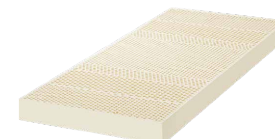
Matratze Honey 13cm