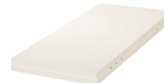
Matratze 2-Flex 13cm