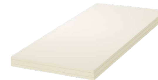
Matratze 2-Flex 10cm