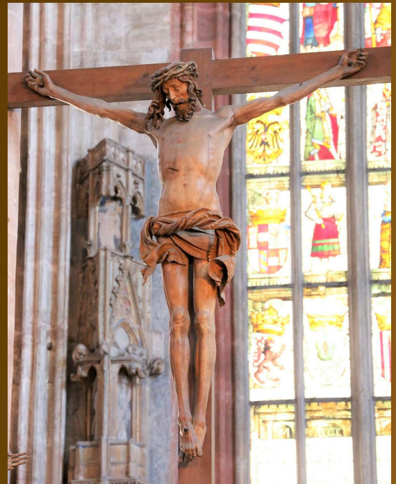
Kruzifix des polnischen Bildhauers Veit Stoß (um 1447-1533) in der Kirche St. Sebald in Nürnberg

Vergleichbar verhält es sich im Inneren der Kirchen. Zumindest bei den älteren katholischen Kirchen ist es fast nicht vorstellbar, dass im Altarraum kein Kruzifix hängt. Das Kruzifix mit der Darstellung des Gekreuzigten kann man in Deutschland auch in lutherischen Kirchen antreffen, in der reformierten Tradition wurde es von Anfang an abgelehnt.